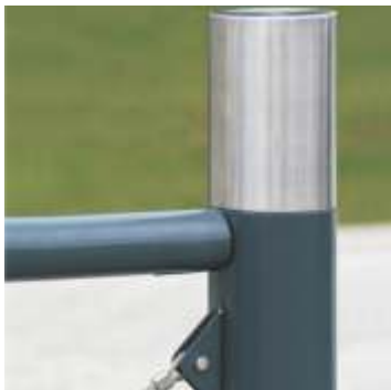
Stâlp Romeo 44040501-P-V